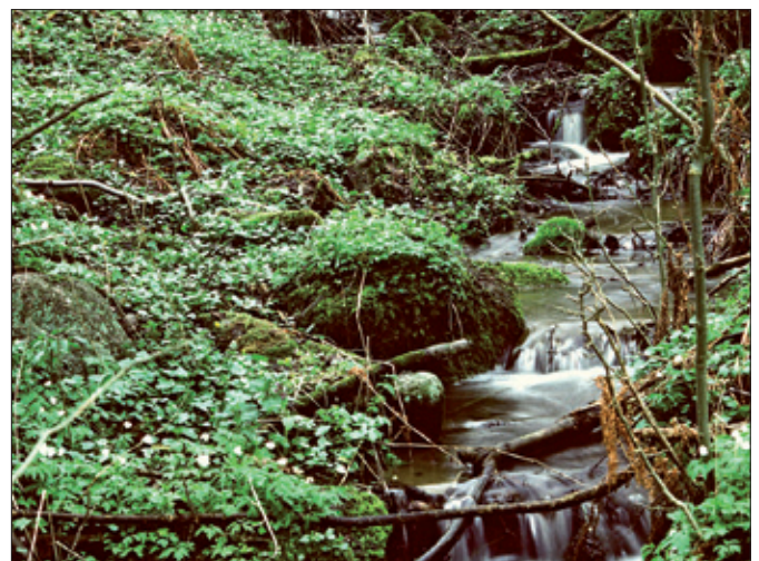
Värdefullt område: Bäckravín.