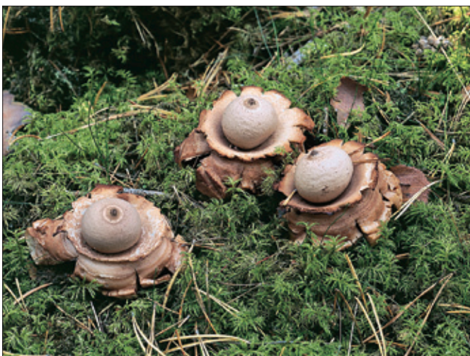
...sällsynta och hotade arter. På bilden kragjordstjärna.