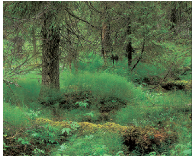
Värdefullt område: Gransumpskog.

Många nyckelbiotoper är fortfarande okända och upptäcks efter hand. Skogsstyrelsen fortsätter därför kontinuerligt att registrera nyupptäckta nyckelbiotoper.