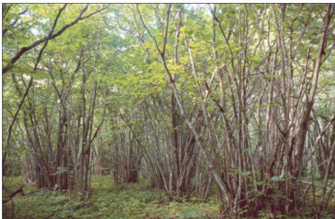
Värdefullt område: Hassellund.

Nyckelbiotoper kan bevaras på flera sätt. Små nyckelbiotoper lämnas som miljöhänsyn vid avverkning i enlighet med 30 § skogsvårdslagen. Många nyckelbiotoper är frivilligt avsatta områden som markägare själva valt att undanta från skogsbruk. En nyckelbiotop kan också få ett formellt skydd, genom att en myndighet skyddar området med stöd av 7 kapitlet i miljöbalken. Oftast handlar det då om ett beslutat biotopskyddsområde eller naturreservat. Vid formellt skydd av nyckelbiotoper är markägaren normalt berättigad till ersättning. För de nyckelbiotoper som gynnas av naturvårdande skötsel har Skogsstyrelsen möjlighet att ge ett ekonomiskt stöd. Markägaren ansöker då om ett så kallat NOKÅS-bidrag.