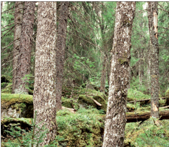
Gamla träd, mossbeklädda stenblock...

En nyckelbiotop är ett område med en speciell naturtyp som har stor betydelse för skogens flora och fauna. Den utgör en livsmiljö för rödlistade arter. Många nyckelbiotoper känns lätt igen på att det är gott om olika nyckelelement såsom gamla träd, död ved, hamlade träd, mossklädda stenblock och bergväggar. Andra nyckelbiotoper kan vara mindre tydliga, men kan utmärka sig genom stor förekomst av speciella arter som påvisar höga naturvärden, så kallade signalarter.