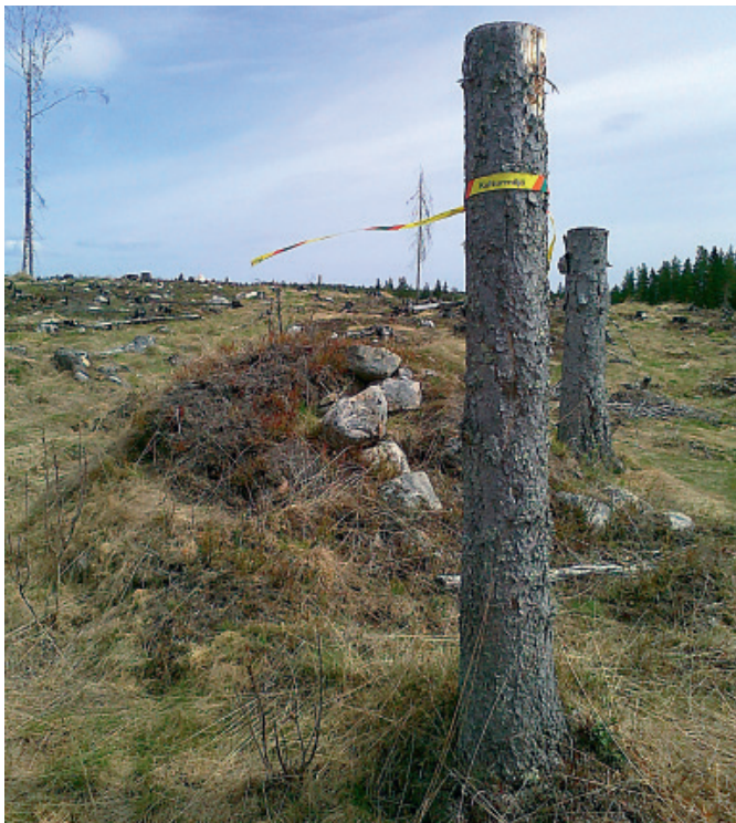
Kulturstubbar, en markering av en av skogens alla kulturmiljöer.

I trakter med höga värden: Spara i första hand miljöer och träd som har höga miljövärden. Det gör du genom att: